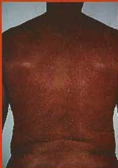
McKee, 1996, Masby-Welsh lid

4 „O půlnoci vycházeli z úkrytu ...“ Upíři byli nočními tvory a existovala domněnka, že denní světlo je může zabit. Současná medicína už zná nemoci, jako je například porfýrie, jejímž jedním z příznaků je citlivost na světlo. Kůže nemocného je normálně bílá, ale po jejím vystavení účinkům světla dochází ke zčervenání a opuchnutí. V některých případech se vytvářejí puchýře, vznikají rány a kůže odumírá.