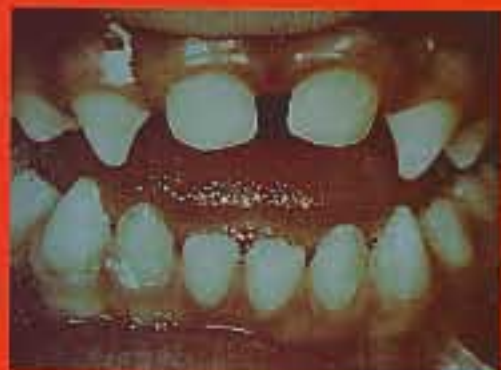
McKee, 1996a, Massey-Walker Ltd

Porovnání výpovědi očítých svědků jevu zvaného vampýrismus obsažených v hlášení rakouských důstojníků Visum et repertum s dnešní lékařskou vědou ukazuje, že legendy o upirech se pokoušely „objasnit“ neznámé fenomény spojené s chorobou a smrtí.