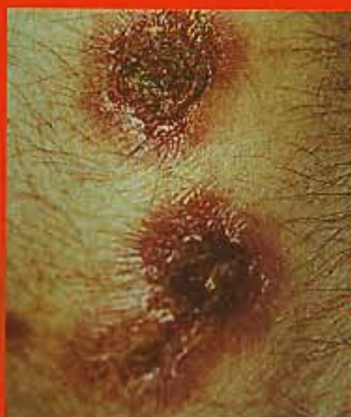
McKee, 1996a, Massey-Walker Ltd

▲ 2 „Ti, kteří byli zabiti upírem, se sami stávají upíry.“ V minulosti každý, u koho byly nalezeny známky napadení upírem, například stopy, které vypadaly jako po klech, byl sám považován za upíra. Spoustu kaňních onemocnění, dokonce i obyčejné puchýře způsobují rány, které připomínají kousnutí. Ta pro řadu vanokavanů v 18. století byla dostatečným důkazem o řádění upíra v nejbližším okolí.